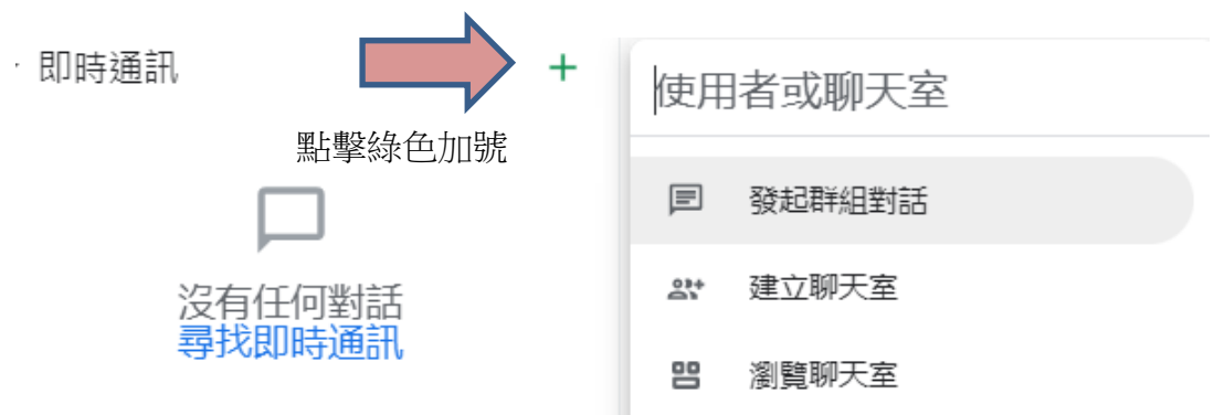
圖 2：建立聊天室和群組對話都需要個人 gmail 帳號