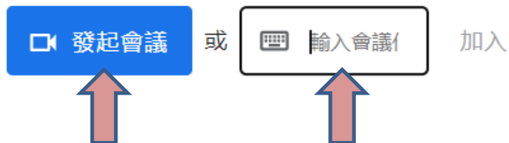
圖 1：發起會議方會有一串代碼輸入，發起會議方持有的代碼即可加入會議。