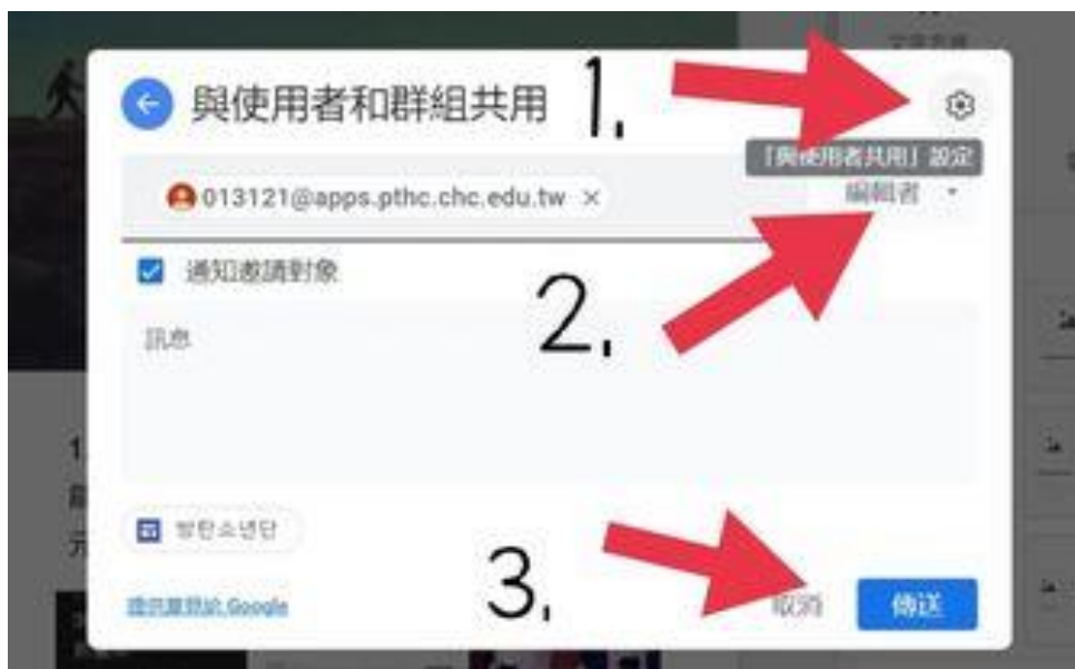
圖 6：與其他使用者共用