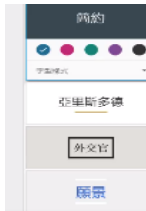
圖 11：協作平台主題選擇