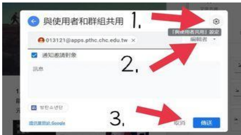
圖 12：實作作平台與他人共用