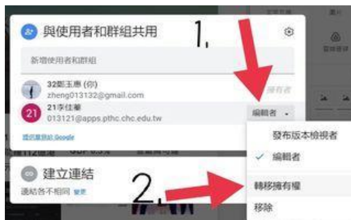
圖 13：實作協作平台停止與他人共用