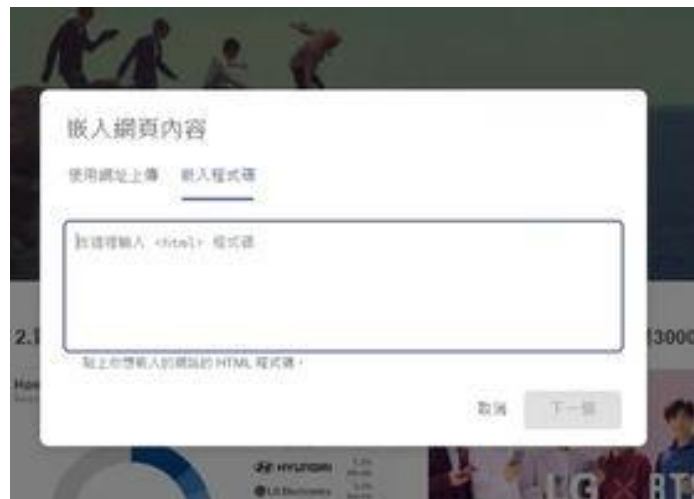
圖 3：新增其他網站內容