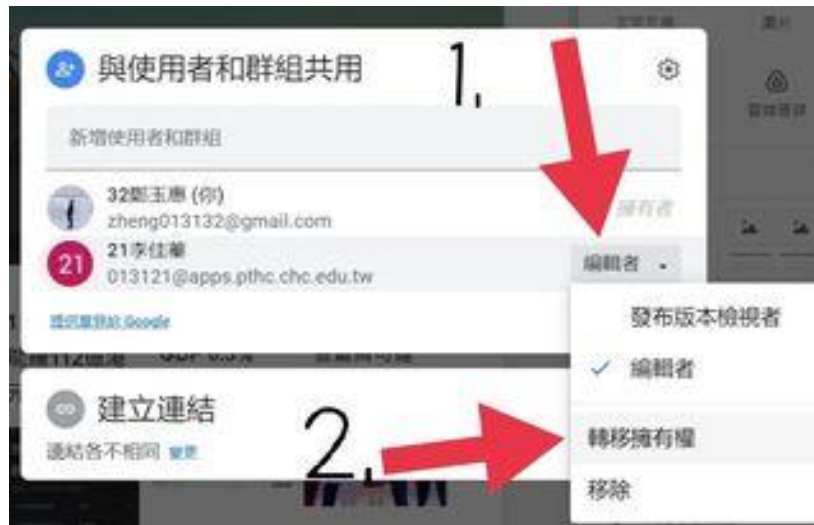
圖 7：停止與他人共用