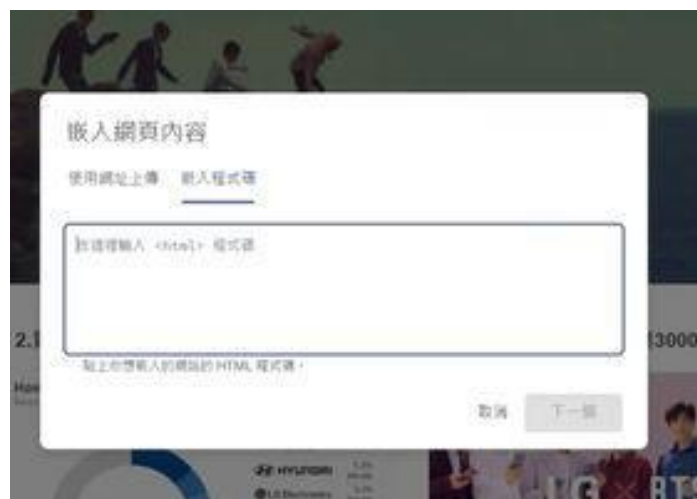
圖 10：實作協作平台截圖