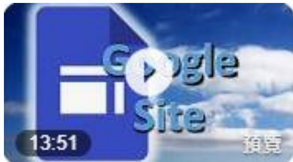
圖 8：Google 協作平台教學